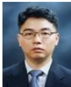
동양자산운용 채권운용본부 본부장

당사 채권운용본부는 경제상황과 자금시장 동향에 대한 분석을 통하여 위험 관리에 기반한 가운데 최선의 투자처에 펀드 자산을 투자함으로써, 은행 예금 금리보다 나은 수익률로 고객님의 자산 증식에 도움이 되도록 노력하겠습니다.